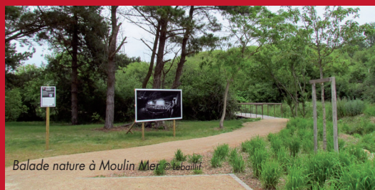
Balade nature à Moulin Mer

A l'époque gauloise, les sables éoliens ont envahi le territoire qui allait devenir le Guilvinec. Des dunes de moyenne hauteur forment un barrage à la mer mais le vent a transporté le sable fin sur un kilomètre et demi jusqu'au ruisseau de Lohan, formant une plaine dunaire.