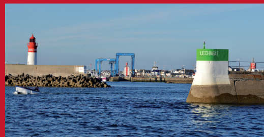
Port du Guilvinec-Léchiagat

La construction de 1871 édifia deux phares dont l'alignement donnait l'entrée du port : la Tour carré à Croas Malo et à la pointe, le petit phare à section carré, qui, jugé trop petit, fut remplacé par un deuxième phare à section ronde de 7m20 à l'extrémité de l'enclos. Il fut achevé en 1902, et le premier phare fut mis en veilleuse. Le gardien des phares logeait dans la grande tour rectangulaire à Croas Malo.