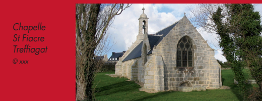
Chapelle St Fiacre Treffiagat

Jusqu'à la création de la paroisse de Léchiagat en 1949, le culte était irrégulièrement célébré dans la chapelle consacrée à saint Jacques. Jugée trop petite, la chapelle a été démolie en 1950 car elle présentait des risques pour la population.