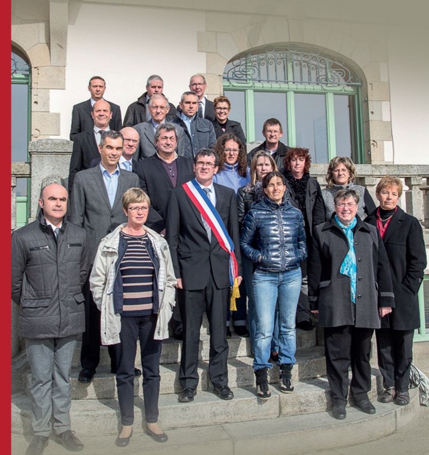
Absentes sur la photo : Marie-Claude Aubrée-Lijour, Michèle Ranzoni

Discours d'installation du conseil municipal - 30 mars 2014