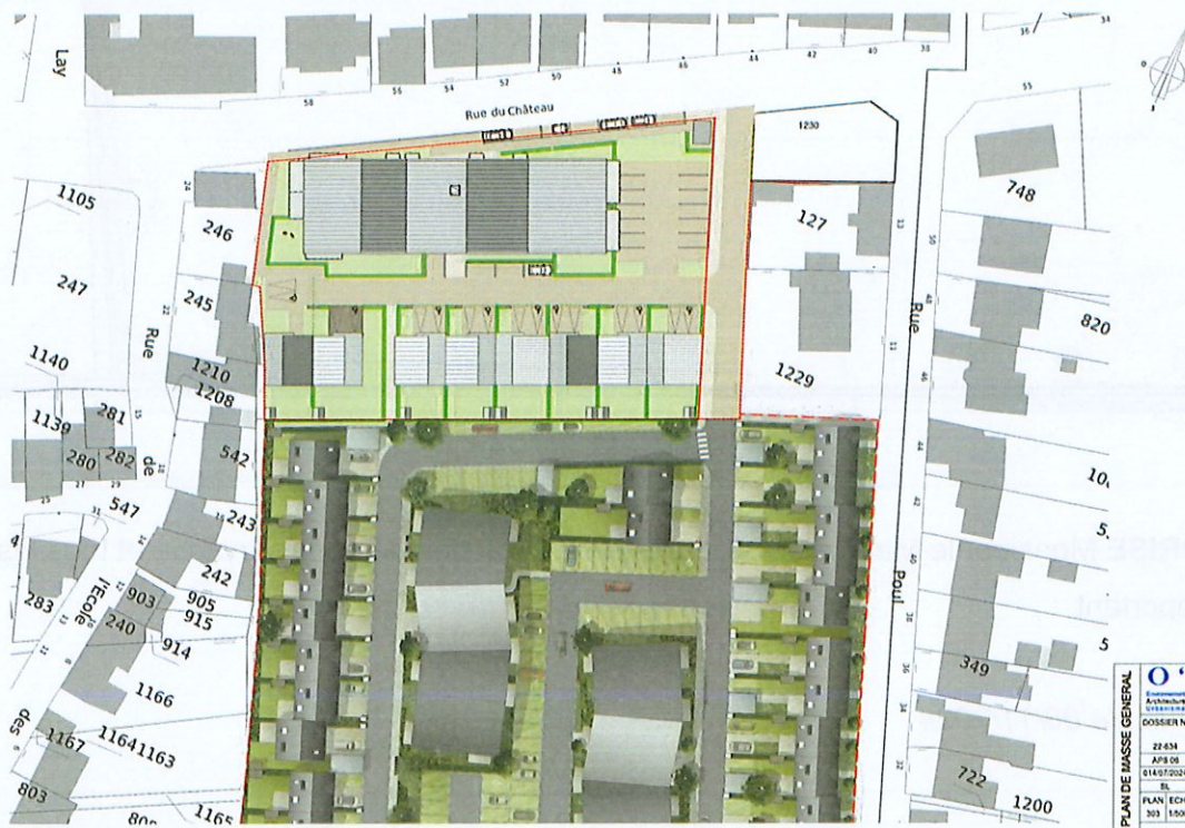
Projet d'aménagement rue du château

Le rapporteur présente au Conseil Municipal le projet immobilier sis à l'ancienne école Jean Le Brun qui prévoit la construction d'une micro-crèche et des logements.